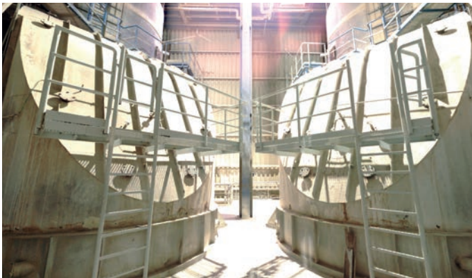
Foto der Anlage